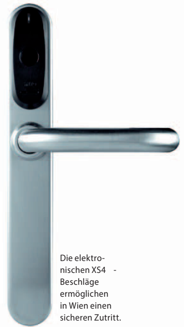
Die elektronischen XS4 - Beschläge ermöglichen in Wien einen sicheren Zutritt.

Die Zutrittskontrolle für die rund 4.500 Zutrittsstellen lieferte in einem umfangreichen Integrationsprojekt die Essecca GmbH aus Bad Fischau-Brunn. Das Unternehmen ist exklusiver Distributor der Lösungen von Salto Systems in Österreich.