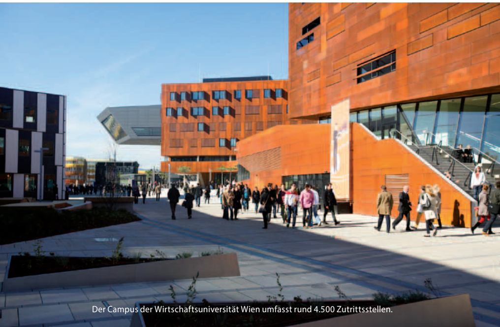
Der Campus der Wirtschaftsuniversität Wien umfasst rund 4.500 Zutrittsstellen.

Bis zu 64.000 verwaltete Personen und 4.500 Zutrittspunkte mussten in der Zutrittskontrolle am neuen Campus der Wirtschaftsuniversität Wien automatisiert werden. Die Essecca GmbH schuf hierfür eine integrierte Lösung mit eigens programmierten Schnittstellen.